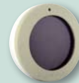
Sunis WireFree RTS Funk-Sonnensensor, solarbetrieben